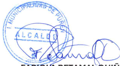
FABIOLA RETAMAL QUIÑONES ALCALDE DE LA COMUNA (S)